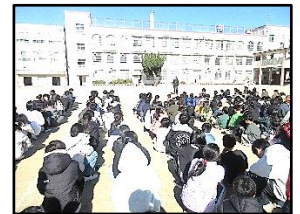
【安全に運動場へ避難】

1月16日(火)、清掃時間中に強い地震が発生したという想定で避難訓練を行いました。まず、近くの教室に入り、机の下にもぐる、倒れてくる危険のあるものから離れるなど、身の安全を確保する行動を取りました。次に、安全を確保するため、運動場に避難をしました。どの学級の子どもも落ち着いて避難することができました。元日には能登半島地震がありました。「ピンチのときこそ、落ち着いて」行動できるよう、日頃から備える大切さを子どもたちに指導していきたいと思っております。