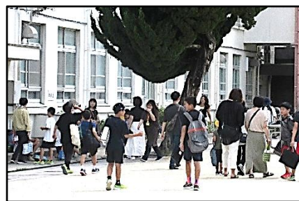
【保護者の方と下校】