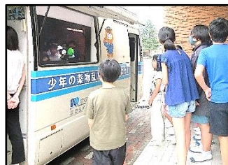
【愛知県警察のバス見学】