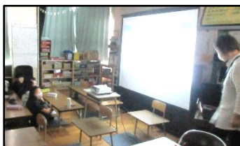
【薬物の危険性について】

インターネットが生活のツールとして欠かせなくなった現代において、子どもたちの目の届くところにも様々な有害情報があふれています。子どもたちが誤った情報を得てしまう前に、正しい知識と薬物乱用の危険性を学ぶ機会を設けることで、将来、子どもたちが覚醒剤や大麻などの違法薬物に手を出さないようにしていきたいです。