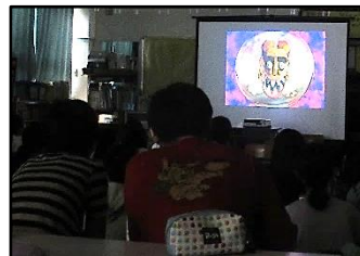
【体、心、命を奪う薬物】