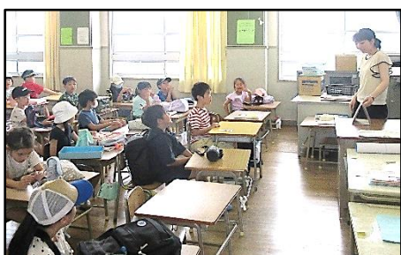
【教室で静かに待機】

お忙しいところ、防災（引き渡し）訓練にご協力をいただき、ありがとうございました。