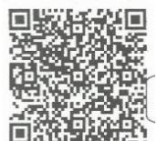
【欠席・遅刻WEB連絡QRコード】