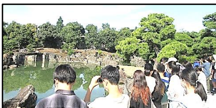
【徳川将軍が眺めた、二条城の庭園】