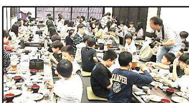
【一瞬の宿泊、一生の記憶】