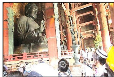
【座った高さ約15mの大仏】