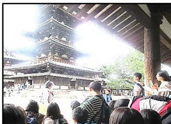
【法隆寺五重塔のつくり】