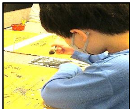
【気分は職人 友禅染】