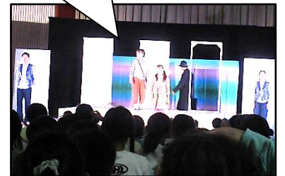
【魅力あふれる劇の世界】