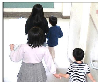
【6年生による親切な誘導】

10月19日(木)、来年度、新入学を迎える子どもたちを対象に就学時健康診断を行いました。今年度は6年生が健康診断の準備や補助、新1年生の誘導などを行いました。6年生の温かい眼差しや、優しい声掛けのお陰で、最初は不安そうなお新1年生も安心した様子でした。6年生は新1年生の入学を待たずに卒業をするので一緒に小学校生活を送ることはできませんが、優しさ、思いやりなど、新1年生にとって、すてきな置き土産になったことと思ひます。