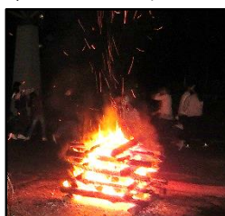
【キャンプファイヤー】