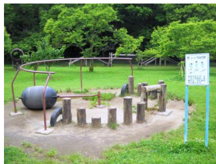
フィールドアスレチック